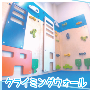
クライミングウォール